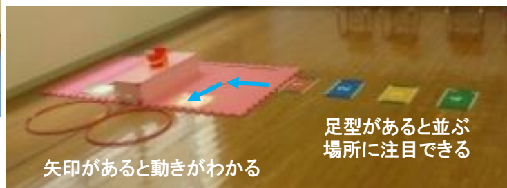
矢印があると動きがわかる