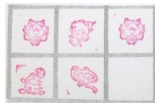
活動が終わるごとにスタンプを押す台紙