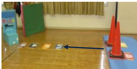
活動の内容や順序が視覚的に わかる配置