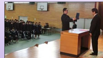
立志式での決意表明