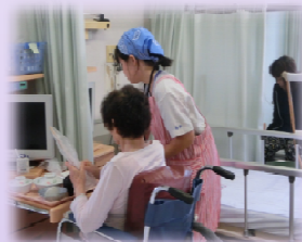
福祉施設での体験

※ 事前の学習として、身近な人へのインタビューやマナー講座、電話対応の仕方、挨拶や服装などの学習を行いました。事前打合せは、夏休みを利用して行い、2学期に町内外の40カ所の事業所の協力を得て、職場体験学習を実施しました。