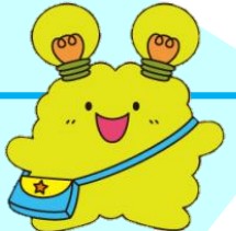
イメージキャラクター「アッピン」