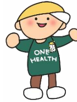
ワンヘルスぼうや