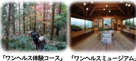
「ワンヘルス体験コース」 「ワンヘルスミュージアム」

体験コースでは、ワンヘルスガイドのもと森林セラピーを体験できます。ミュージアムでは、「ワンヘルスって何?」を楽しく学ぶことができます。